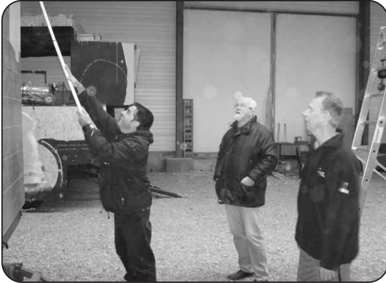
Impressionen vom ersten Waagenbau am 27. Oktober 2007