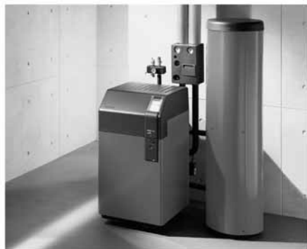
Kompaktheizeinheit Weishaupt Thermo Unit: Für Ein- und Mehrfamilienhäuser.

Für die Beheizung von Ein- und Mehrfamilienhäusern