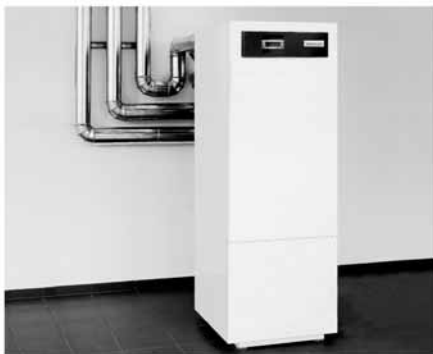
Weishaupt Wärmepumpen Das Weishaupt Wärmepumpen-Programm: Für jede Anwendung die passende Lösung.