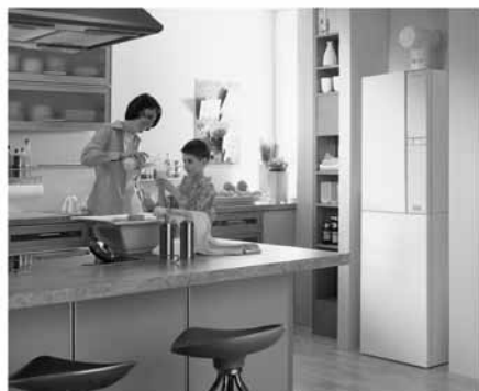
Gas-Brennwertgerät WTC-Kompakt. Effiziente Wärme ist keine Platzfrage.