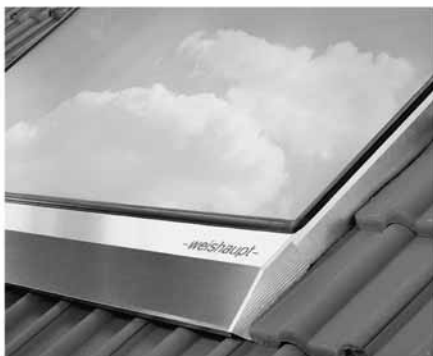
Weishaupt Sonnenkollektor kombiniert mit Gas, Öl oder Wärmepumpe. Wärme von der Sonne.